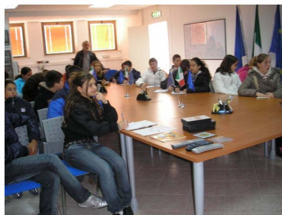
I ragazzi nella sala operativa

I ragazzi sono entrati poi, nella sala operativa, dove si riuniscono, in caso di calamità naturali, il Presidente della Provincia, il Prefetto, i Vigili del Fuoco ed insieme cercano di affrontare e risolvere i problemi più urgenti.